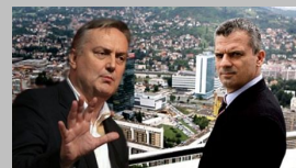
Općinski načelnik Fuad Šišić