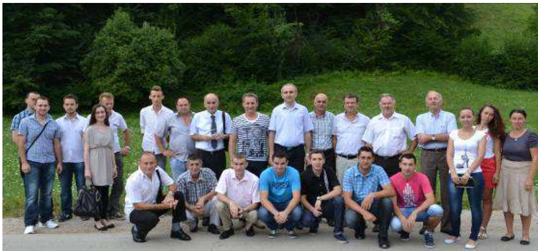
Zajednička fotografija ispred OŠ „Gazi Ferhad-Beg“ u Jablanici